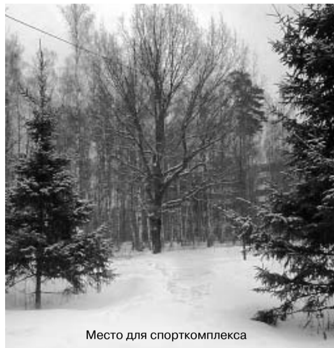
Место для спорткомплекса

За период с августа 2005г. инициативная группа жителей микрорайона «А» провела громадную работу, чтобы защитить зеленую зону своего микрорайона от застройки жилыми домами «Наука-2»: собрали подписи, а затем более 3 месяцев доказывали их подлинность. Сейчас проектирование прекращено. Остались только вопросы.